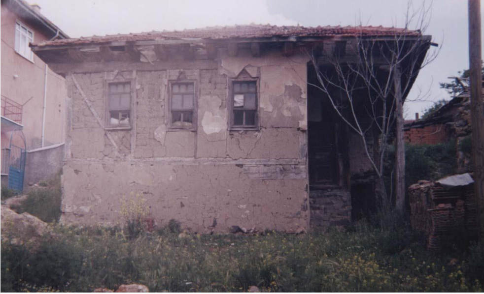
Yukarı Oda (Restorasyondan Önce)