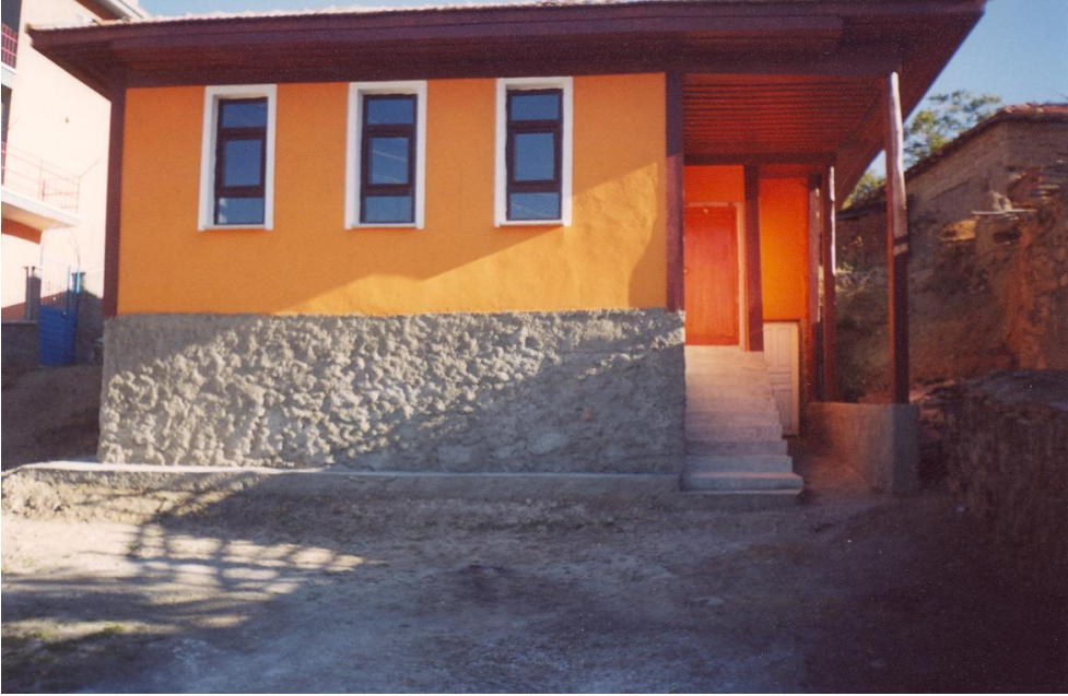
Yukarı Oda (Restorasyondan Sonra) (Restorasyon tarihi: Eylül-2004)