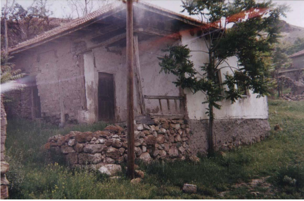
Hacı Halil'in Oda